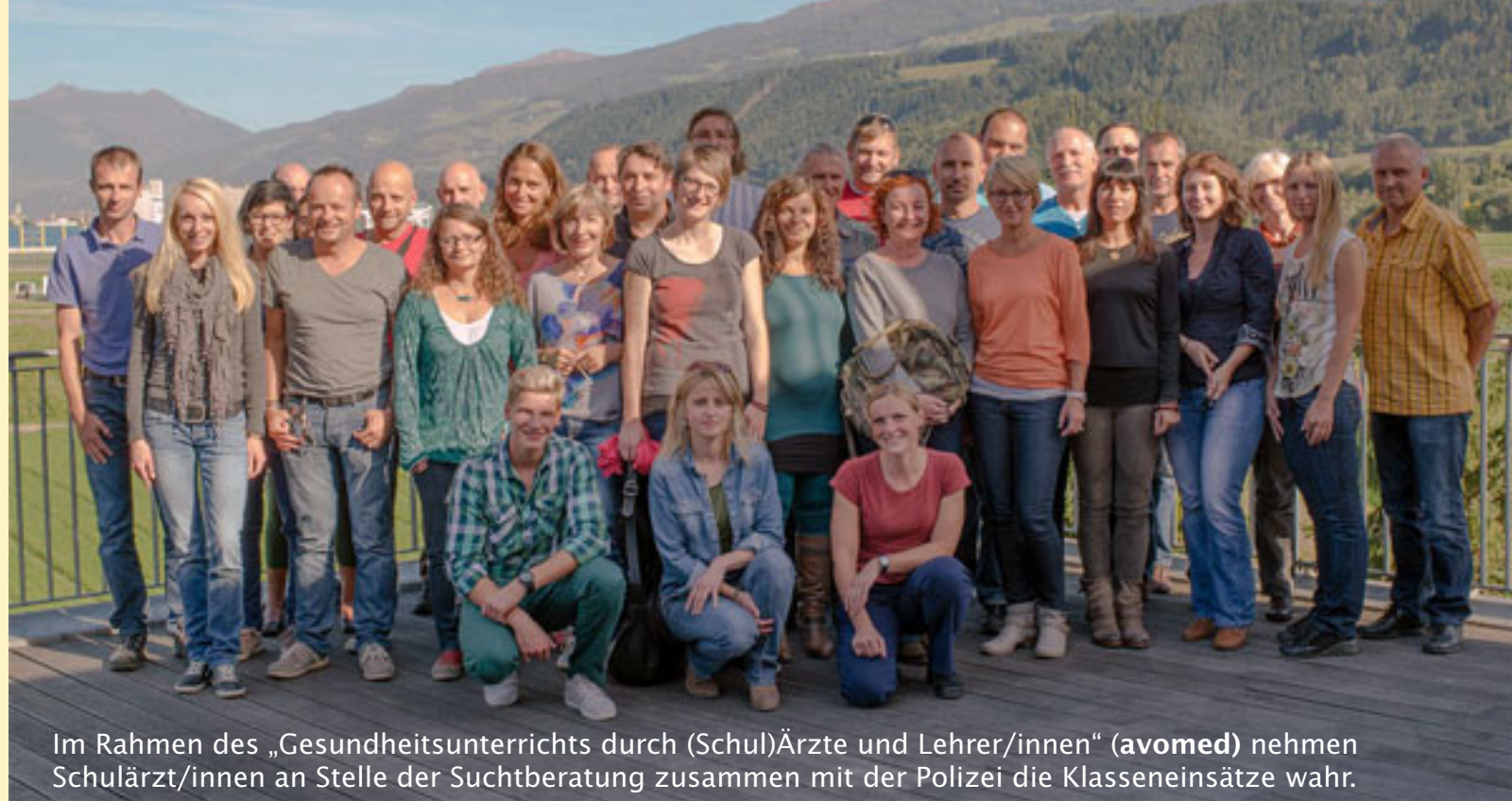
Im Rahmen des „Gesundheitsunterrichts durch (Schul)Ärzte und Lehrer/innen“ ( avomed ) nehmen Schulärzt/innen an Stelle der Suchtberatung zusammen mit der Polizei die Klasseneinsätze wahr.